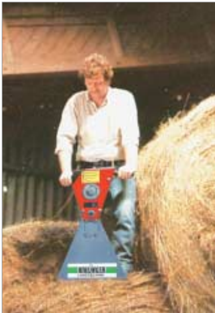
Die HIRLINGER-Futtersäge eignet sich auch hervorragend zum Auftrennen von Rundballen.

wie einfach man mit diesem leichten, handlichen Gerät arbeiten kann und was es leistet. Sie erhalten die Futtersäge 10 Tage zur Probe. Danach entscheiden Sie, ob Sie unsere Rechnung bezahlen, oder die Futtersäge an uns zurück senden. Sie brauchen nur den Test-Gutschein auszufüllen oder einfach anzurufen.